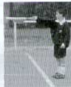
au centre du terrain