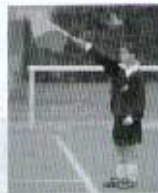
du côté opposé à l'assistant